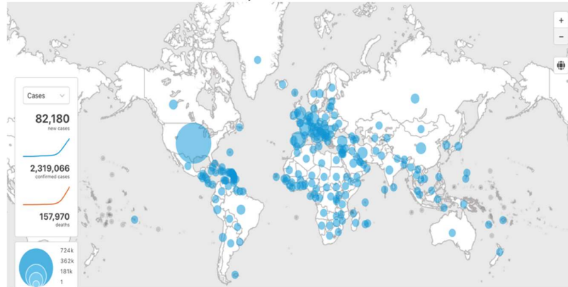
Gambar 1. Penyebaran Covid-19 di Dunia